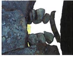
Au dolmen de Vaon

A près avoir contourné l'étang communal des Trois-Moutiers par l'Ouest, l'itinéraire emprunte une portion de terres humides et mène à l'ancien moulin à eau de Barouze A . C'est dans cet environnement de vallons verdoyants au milieu de la plaine céréalière que se cache le lavoir communal de Barouze, joliment restauré B . Au bout de ce chemin enherbé, vous avez la possibilité de remonter vers le Nord pour découvrir le mégalithe le mieux conservé de la région, le dolmen de Vaon (2,8 km en portion AR, sentier non balisé - voir plan et photo de couverture).