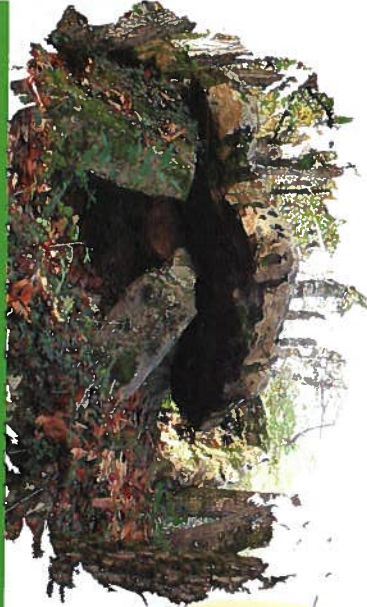
Dolmen de la Roche-Vernaize