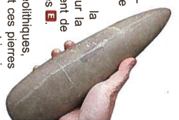
Hache en pierre polie

Remontez vers le hameau de Saint-Dremond en passant devant les caves et le gros amandier de la Roche-Vernaize D . Avant d'arriver à Saint-Dremond, sur la gauche, au point culminant (belle vue sur la région), remarquez un nouvel entassement de pierres détruites déjà depuis des décennies E .